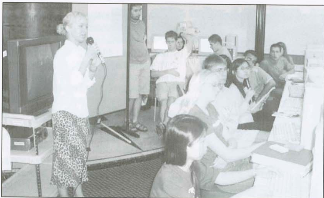
▲各國 NEO 在電腦中心學習如何在網路上進行交換學生的合約

NEO 之上的領導者與 NEO 之間的互動模式有何不同。」是對活動的任務與使命的認同，才有這樣的熱忱與興趣吧。